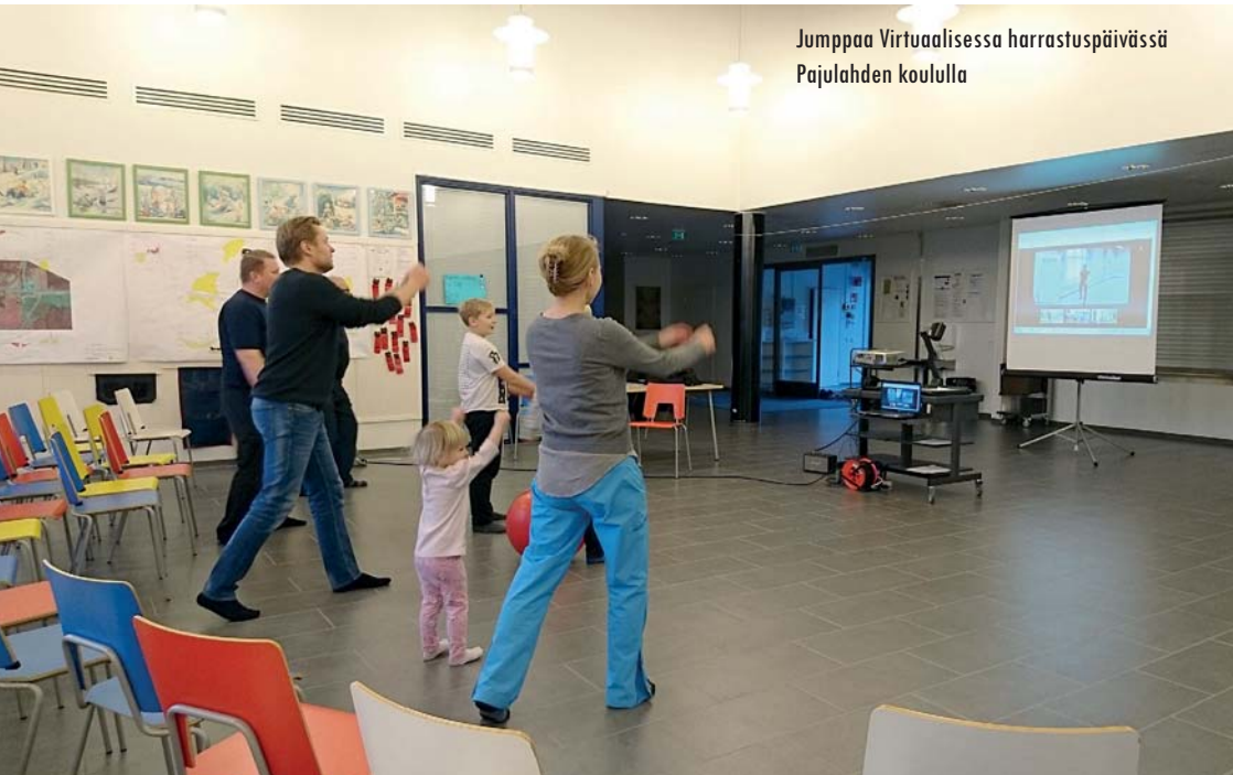
Jumpaa Virtuaalisessa harrastuspäivässä Pajulahden koululla