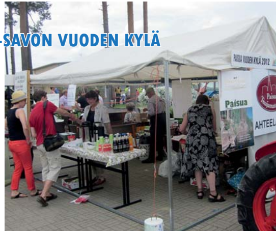
Paisuon kylä esittäytyy myös tapahtumissa. Tässä osasto Eukonkannossa.

Yhteisin ponnistuksin ylläpidettäviä kokoontumispaikkoja on Paisuassa kaksi; kyläseuran omistama ja kunnostama kylätalona toimiva entinen koulu sekä maa- ja kotitalousseuran Ahteela-seurantalo. Kylätalon kunnostus on ollut kyläläisille suuri ponnistus. Se palvelee laajemminkin Sonkajärven, Lapinlahden ja Iisalmen seudun asukkaita. Yhteishenkeä vahvistavat monipuoliset tapahtumat. Paisuon Tuajamateatterin vieriäminen ja esitysten kehittyminen pitkiksi näytelmiksi on tuottanut kulttuurielämyksiä laajalti ympäristöön. Teatteri sai Sonkajärven kulttuuripalkinnon v. 2010. Uusin näytelmä Munakukulalta b(Rysseliin) esitettiin kevätkaudella 2012. Tuoreita tapahtumia ovat myös tänä kesänä palvelut kesäkahvila ja koulutarvikenäyttely.